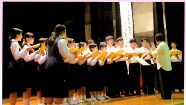
旭中学校の皆さん

1.光のない夜の中で 月のように見守られ 輝いてとけてく不安 はげまし隊の魔法にかかる ほほえみと優しさで 温まる心 今 その眼差しが 希望に変わる