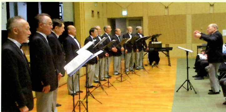
ひむかグリーンクラブの皆さん